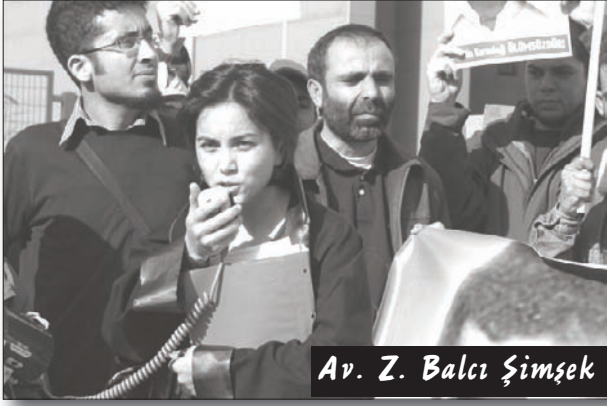
Av. Z. Balcı Şimşek