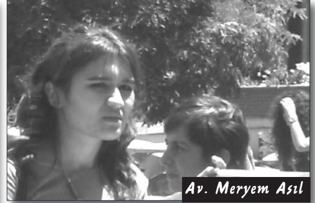
Av. Meryem Asıl

Bu açılardan adalet sistemini sorgulasak da, en azından sanığın duruşmalardan vareste tutulması talebinin reddedilmesi bizim açımızdan olumlu olmuştur. Bunun yanısıra olayla ilgili olarak keşif yapılmasına karar verilmiştir. Dileriz yapılacak olan keşif, olayın aydınlatılmasına bir nebze de olsa ışık tutar. Bizler Karadağ Ailesi'nin avukatları olarak, davayı sıkı bir biçimde takip etmeye devam edeceğiz. Umuyoruz ki bu yargısız infaz cezasız kalmaz ve Alaattin Karadağ'ı katleden polis gereken cezayı alarak, adalet ve hukuk sistemine olan güvenimizi biraz